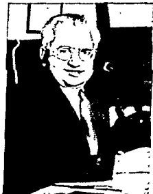
श्री मोहराम, लाहौर